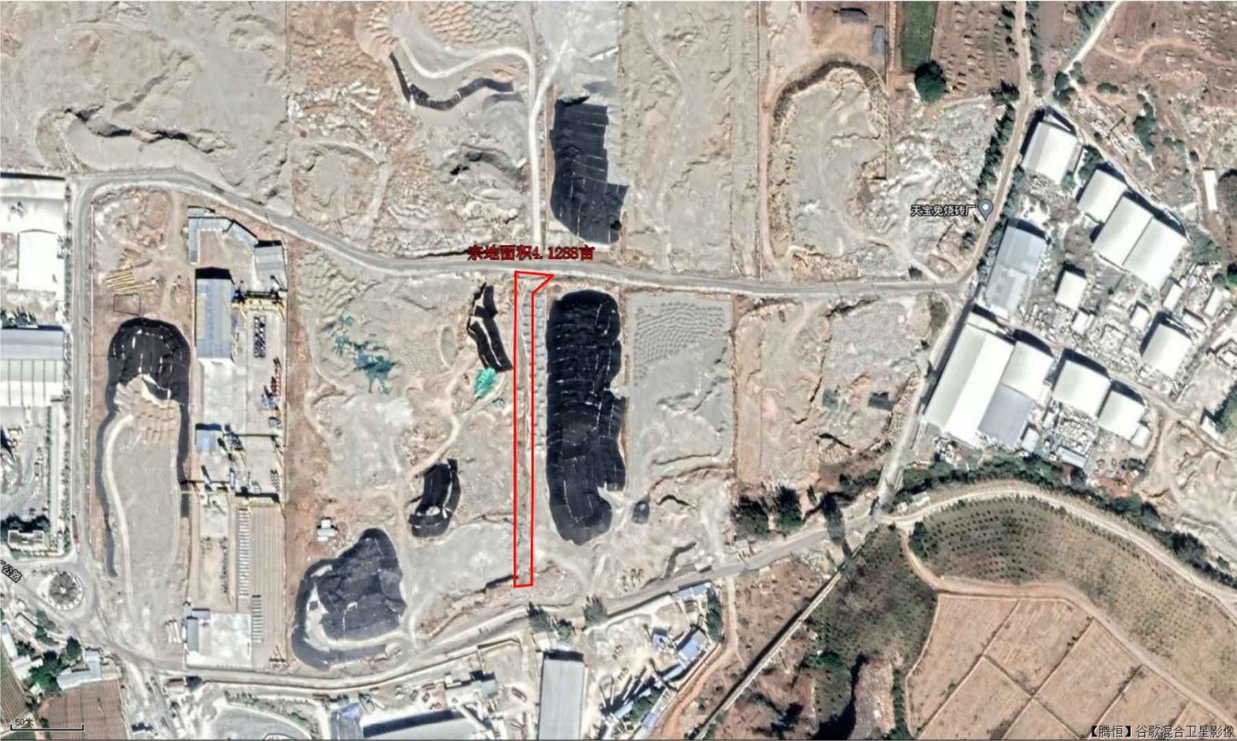
宾川产业园区狮子口片区道路建设项目用地影像图